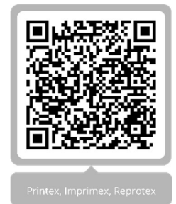
Printex, Imprimex, Reprotex